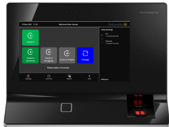
Abbildung: dormakaba Zeiterfassungsterminal 9700 mit individuellem Nutzerdialog